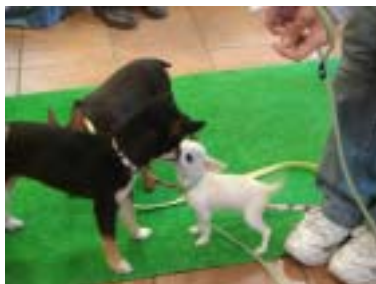
東京都代官山 スリードッグベーカーリー