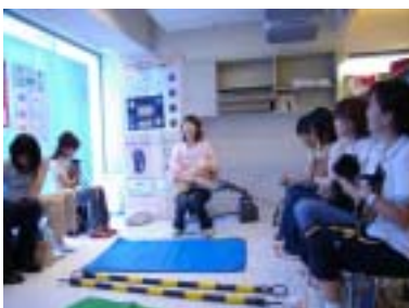
東京都銀座 わんわんネバーランド