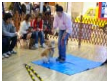
東京都お台場 ペットシティ