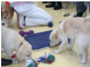
北海道旭川 緑の森どうぶつ病院